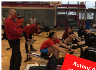
Retour des compétitions

Les difficultés principales pour préparer ce grand évènement ont bien sûr été liées à la pandémie. Des membres de l'équipe ont été absents à cause du virus et n'ont pas pu suivre une partie des entraînements ou tests programmés. C'est seulement le jour J que nous avons su qui était vraiment apte à pouvoir ramer... Lors des entraînements, nous devons prendre des précautions pour ne pas brasser les élèves et maintenir autant que possible la distanciation ; il y a donc moins de collaboration que